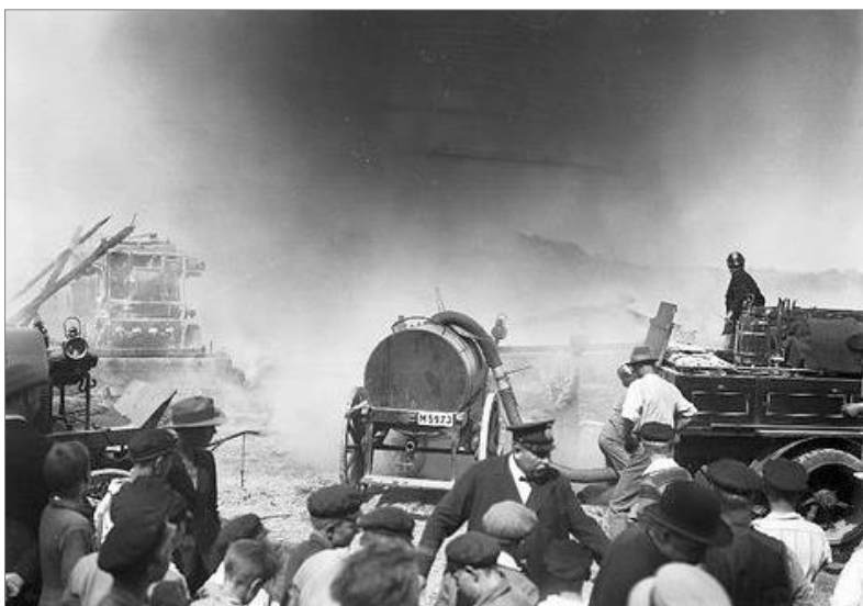
Vattenvagnarna i bruk vid större brand i Elinelunds gård den 10 april 1928. Vattenvagnen i mitten bär dragbilens registreringsskylt. Till vänster skimtar den andra vattenvagnen där dragstången sticker fram. Den har sannolikt varit kopplad till den första vattenvagnen som i sin tur varit kopplad till den kombinerade pump- och lastautomobilens vars bakände syns till höger på bilden.