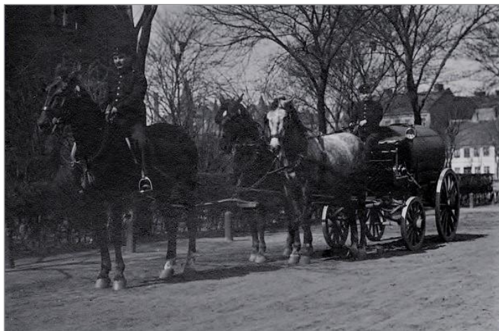
Tankvagn efter tvåspänn med förridare. Kornettsgatan omkring 1905.