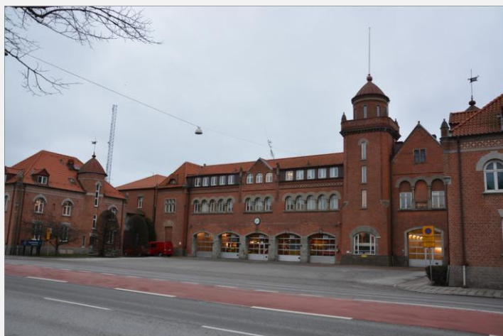
Stationen sedd från Drottninggatan.