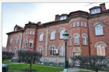
Första befälsbyggnaden ligger mot Kungsgatan.

Vid årsskiftet 2014-2015 lämnar rådningstjänsten byggnaden utmed Kungsgatan.