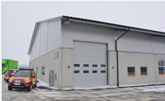
Stationen har en port och är placerad i en del av en företagsbyggnad.

3390 Mindre enhet (från början kallad 3360).