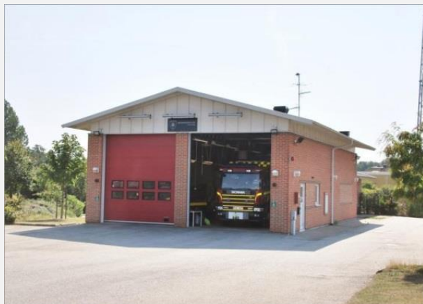
Stationens framsida med två portar. Bortre delen är personalutrymmen.