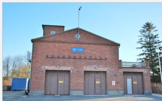
Stationens framsida med tre portar varav två används. Övervåningen med fönster längs sidan har personalutrymmen och samlingsal. Fastighetsägaren disponerar del av byggnaden.