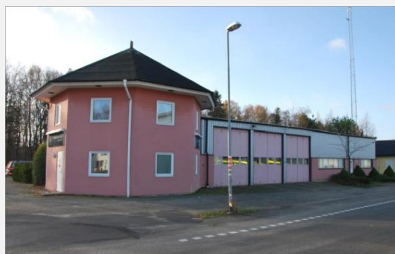
Stationens framsida har tre portar. Tornbyggnaden utgör personalutrymmen och kontor. Kommunal verksamhet i bortre delen, med port mot baksidan.