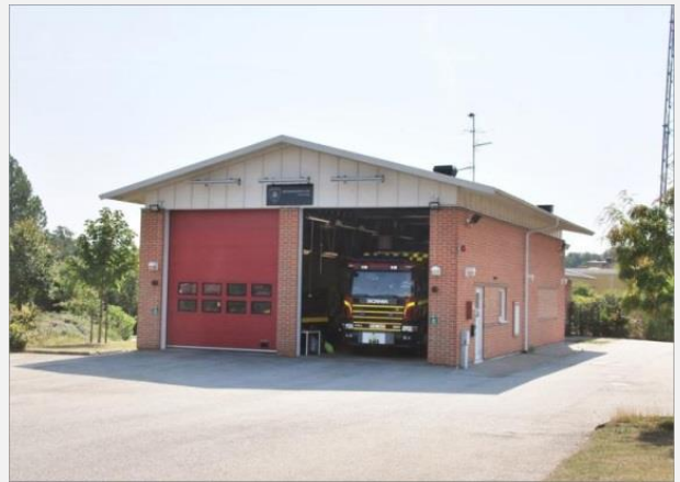
Stationens framsida med två portar. Bortre delen är personalutrymmen.

De operativa fordonen i april 2016 bestod av: 4140 Tankbil 4160 Transportbil