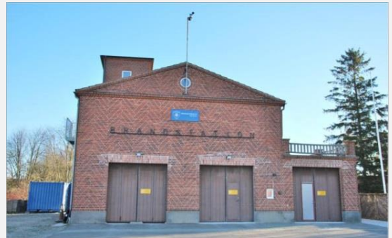
Stationens framsida med tre portar varav två används. Övervakningen med fönster längs sidan har personalutrymmen och samlingsal. Fastighetsägaren disponerar del av byggnaden.

De operativa fordonen i april 2016 bestod av: 3470 Transportbil 3490 Mindre enhet