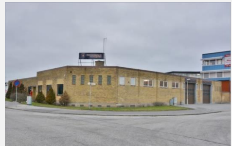
Ovan station Rosengård 2014, nedan station Öster 2008.

Nedan garaget som nu disponeras på station Centrum.