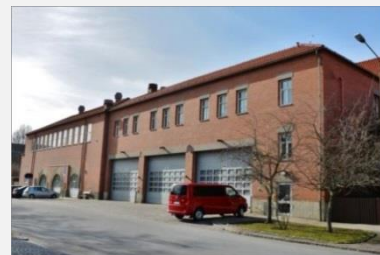
Stationen sedd från Brandmästaregatan. Äldsta delen längst bort.