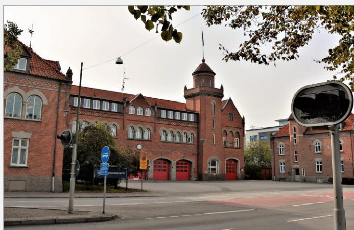
Stationen sedd från Drottninggatan.