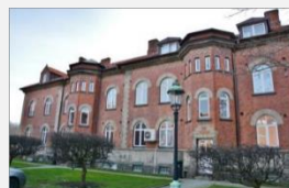
Första befälsbyggnaden ligger mot Kungsgatan.

2016 flyttar Rådningssvårnet (MFB) in på stationen.