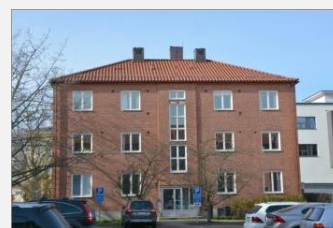
Expeditionsbyggnaden mot Latinskolan.