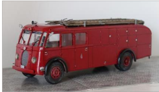
Brandbuss nr 17. Volvo B20 1939.