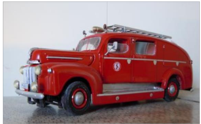
Rökdykarpiket nr 7. Ford V8 1947.