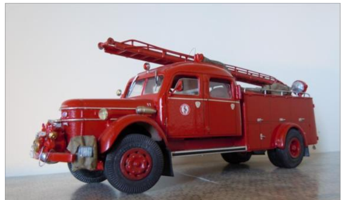
Medeltung brandbil nr 11. Volvo LV127 1950.