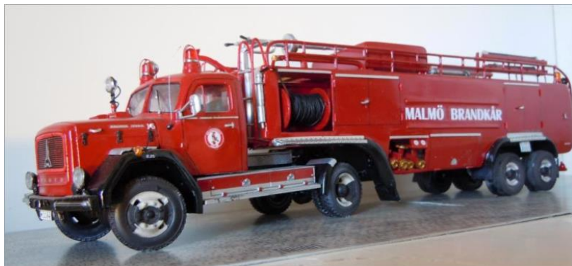
Tankbil nr 15. Magirus Deutz 170D 1966.