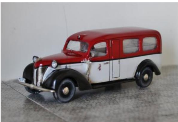
Ambulansbil nr 23. Volvo PV 810 1945.