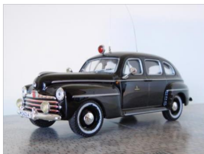
Brandchefens bil nr 1, senare läkarbil nr 29. Ford V8 1947.