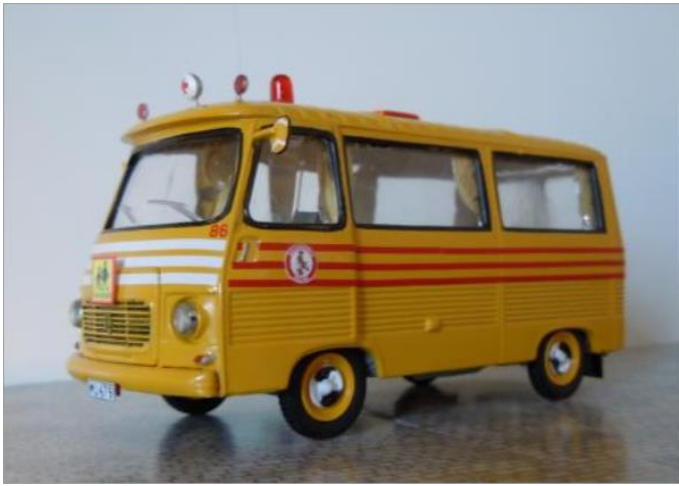
Färdtjänstbuss nr 86. Peugeot J7 1967.