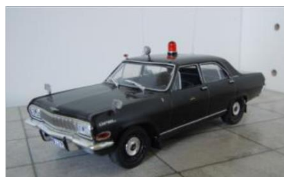
Läkarbil nr 3. Opel Kapitän 1965.