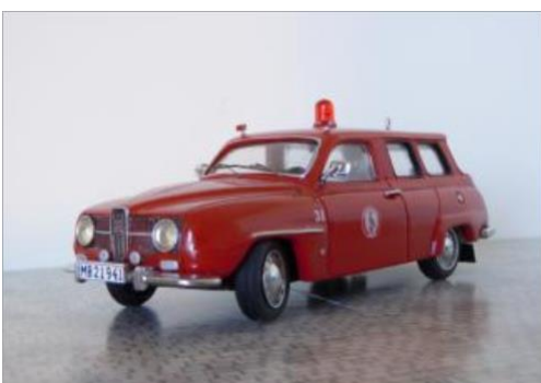
Servicebil nr 31. SAAB 95 1968.