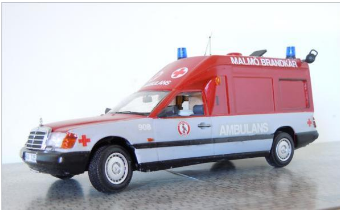
Ambulans nr 908. Mercedes Benz 230E 1988.