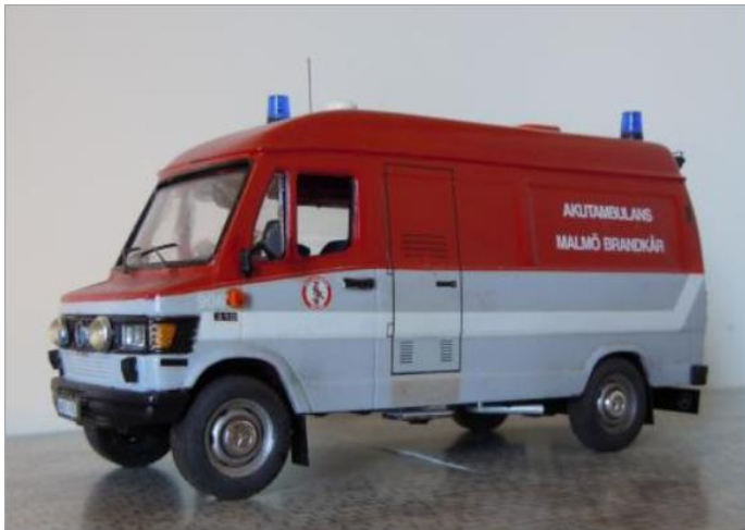
Akutambulans nr 906. Mercedes Benz 310 1986.