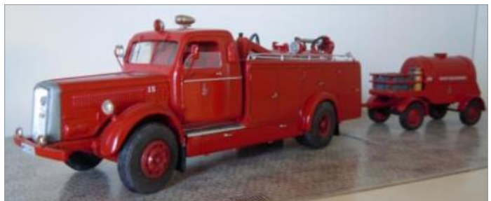
Tung brandbil nr 15. Volvo LV292 1947. Skumsläpvagn nr 15 B