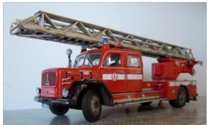
Stegbil nr 160. Magirus Deutz 150 1964. Stege DG230. Reservbil.