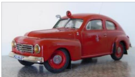
Befälsbil nr 2. Volvo PV 444 1947.