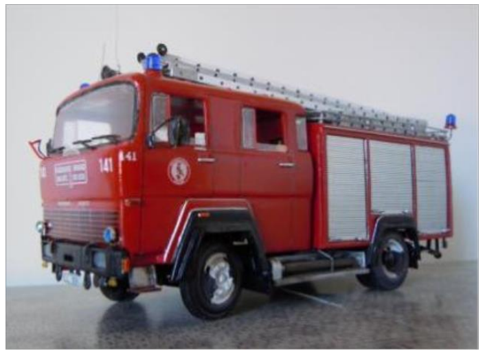
Släckbil nr 141. Magirus Deutz 170 1972.