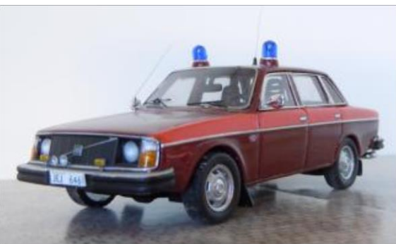
Personbil nr 105. Volvo 244 1976.