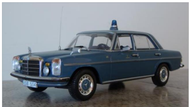
Brandchefsbil nr 101. Mercedes Benz 250 1971.