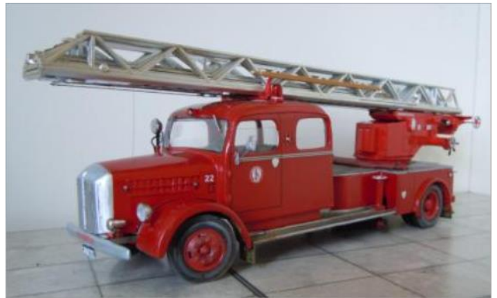
Stegbil nr 22. Scania Vabis L23 1949. Ny steg typ DG230 innan reflexmärkingen 1969.