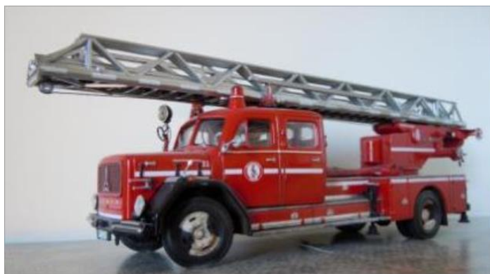
Stegbil nr 21. Magirus Deutz 150 1964. Stege DG230. Samma bil som ovan men från 1969 när den blev reflexmärkt.