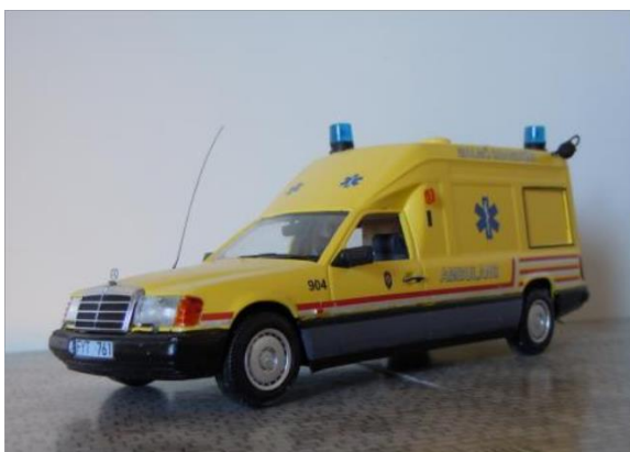
Ambulans nr 904. Mercedes Benz 230E 1989. Ny målning 1994.