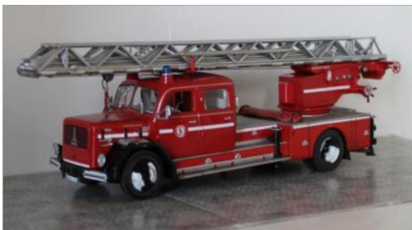
Stegbil nr 121. Magirus Deutz 150 1964. Stege DG230.