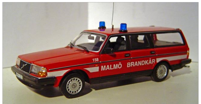
Personbil nr 158. Volvo 245 1986.