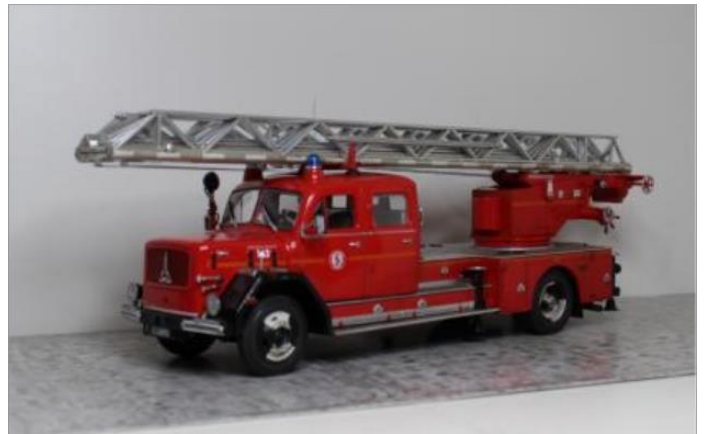
Stegbil nr 143. Magirus Deutz 150 1964. Orange reflexmärkning.