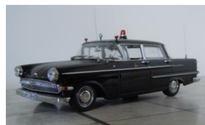
Läkarbil nr 29. Opel Kapitän 1960.