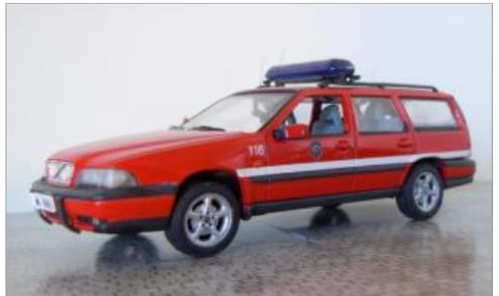
Befälsbil nr 116. Volvo V70 AWD 1998.