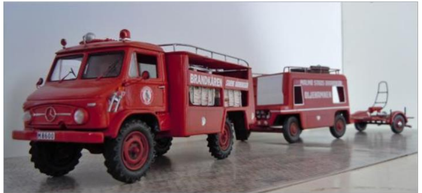
Slangbil nr 17. MB Unimog 1960 med skumsläp 102 och skum/vattenkanon..