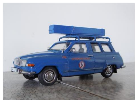
Sotarbil nr 198. SAAB 95 1975.