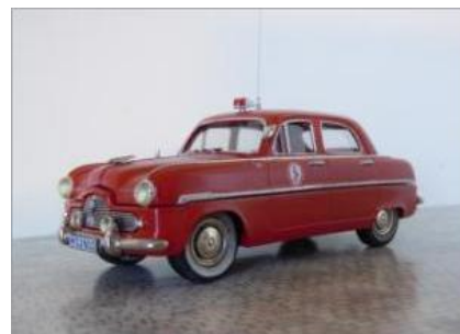
Läkarbil nr 29. Ford Zephyr 1953.