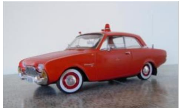
Besiktningbil nr 18. Ford Taunus 17M 1961.