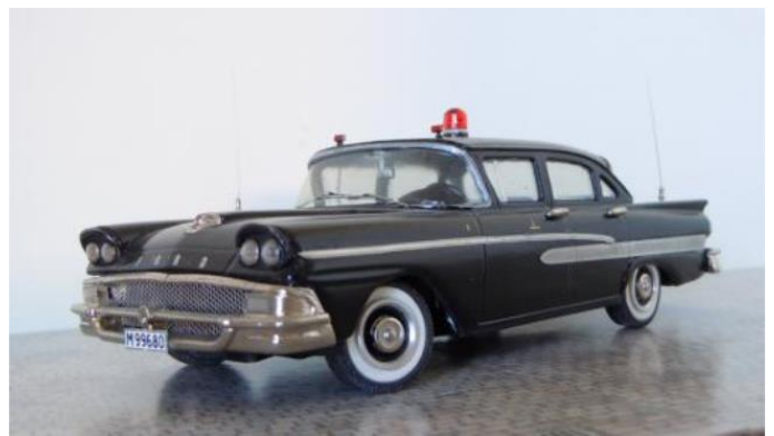
Brandchefens bil nr 1. Ford Custom 300 1958.