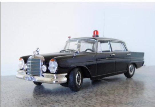
Brandchefsbil nr 1. Mercedes Benz 220 1964.