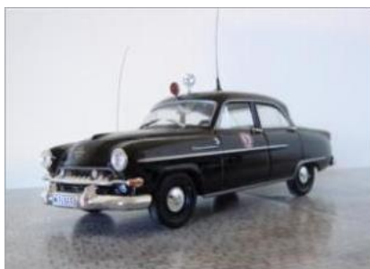
Läkarbil nr 9. Opel Kapitän 1955.