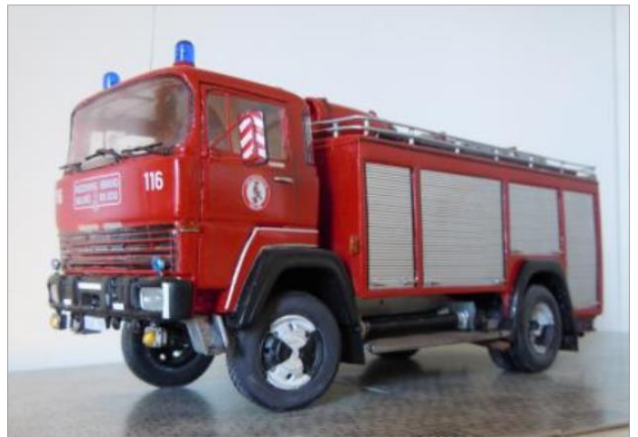
Tänkbil nr 116. Magirus Deutz 232 1973.