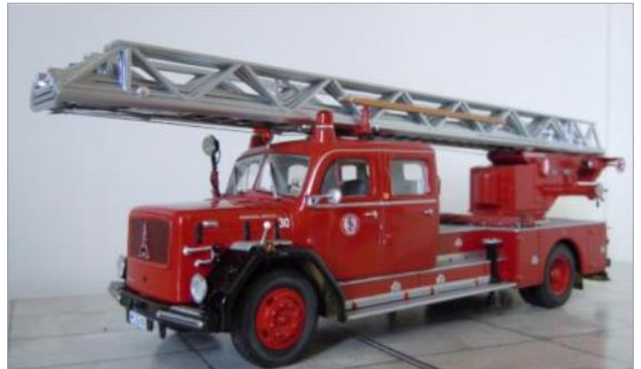
Stegbil nr 30. Magirus Deutz 150 1964. Steg typ DG230.