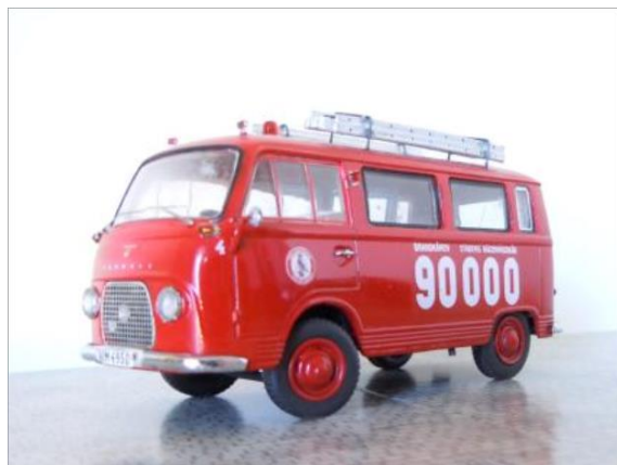
Servicebil nr 4. Ford Transit 1962.