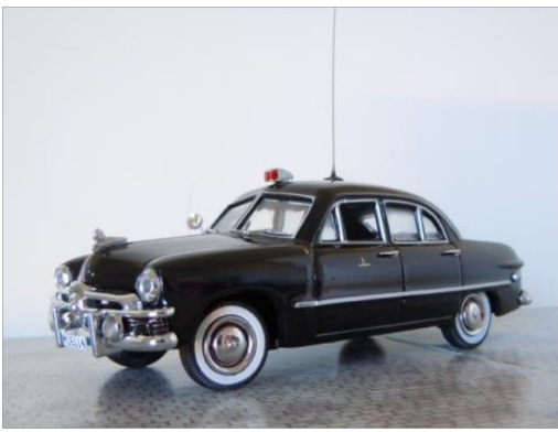
Brandchefens bil nr 1. Ford Custom 1949.