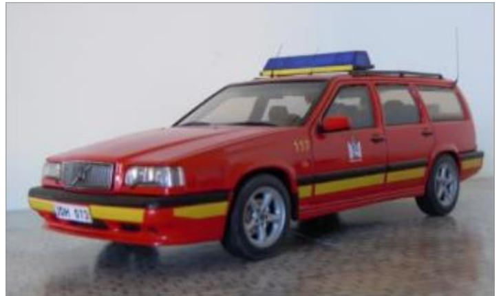
Befälsbil nr 117. Volvo 855 1996.