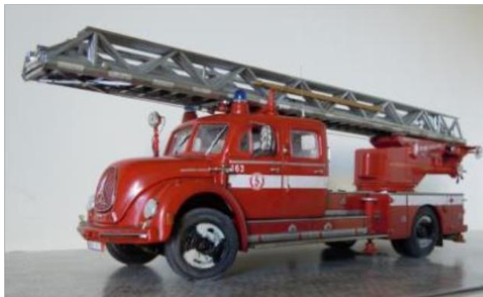
Stegbil nr 163. Magirus Deutz 125 1960. Stege DG230. Fd bil 123. Reservbil.