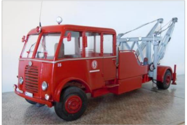
Bärningsbil nr 35. Scania Vabis 1932/1950.