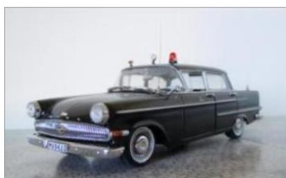
Läkarbil nr 9. Opel Kapitän 1962.