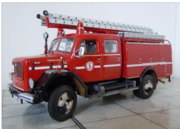
Släckbil nr 11. Magirus Deutz 150 1968.