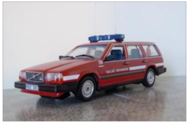
Befälsbil 106. Volvo 745GL 1988.