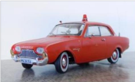
Besiktningbil nr 2. Ford Taunus 17M 1961.