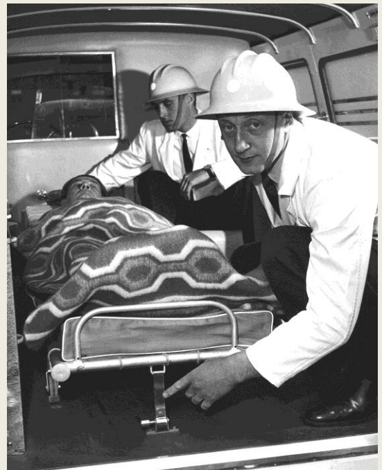
Nyheter: Lös handlykta, spärranordning för båren, röd skiva att montera på den bakåtriktade arbetslyktan.