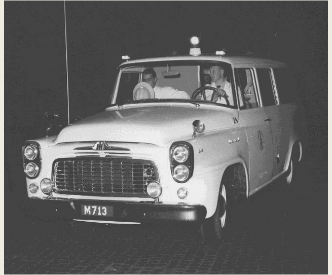
Nyheter: Skyddshjälm för personalen, säkerhetsbälten för personal och för sittande i vårdhytten. M713 = MA20571.