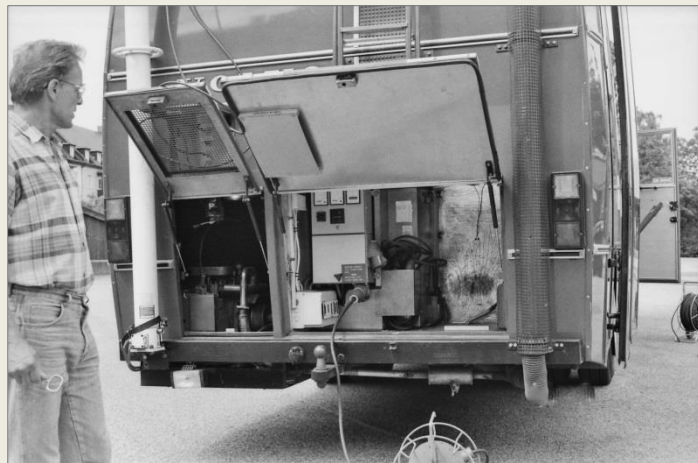
Elgenerator 10 kW/380 V i vänstra och elcentral i högra skåpet.