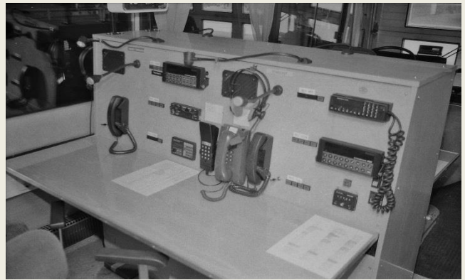
Räddningstjänsten till vänster och stabschefen till höger.