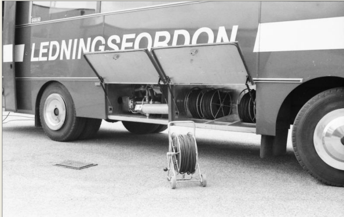
Förråd av elkabel på vindor.