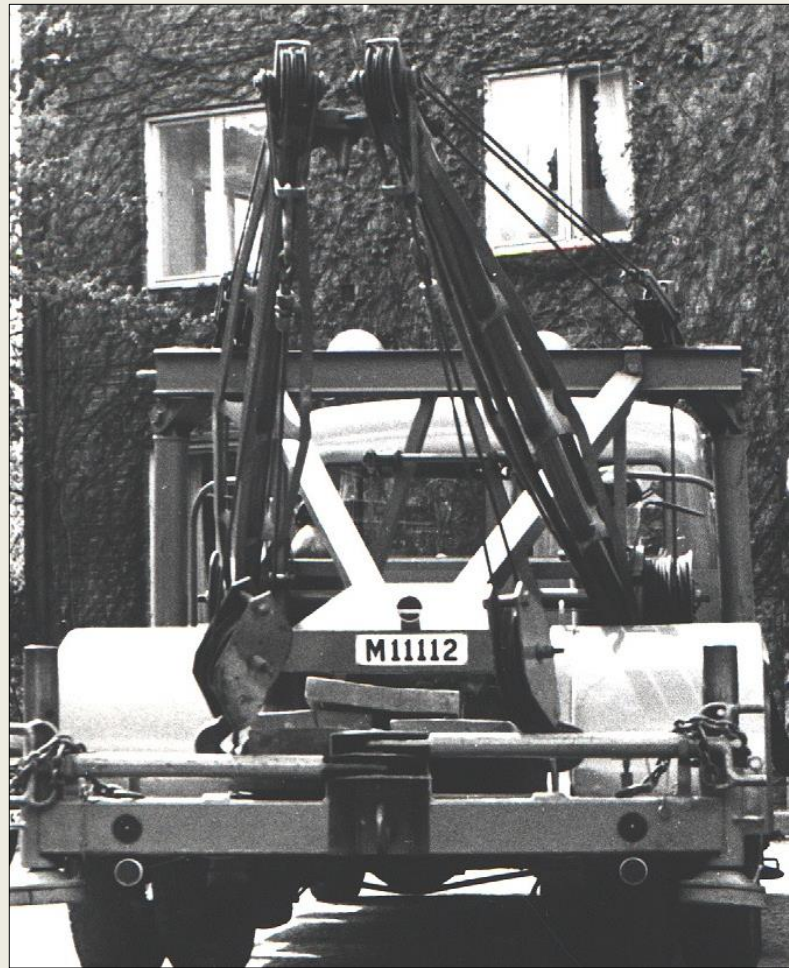
Bärningsaggregat typ Holmes/Tranås.