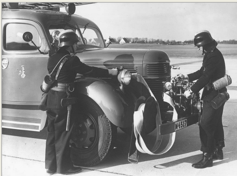
M4517 levererades med frontpump med färdigkopplad slang och Kometrör (skum).

M4517 fick samma typ av skåp som de båda tidigare bilarna M2920 (Bil 5 och 12) och M52 (bil 19,35 och 13) fick efter 2:a världskriget.