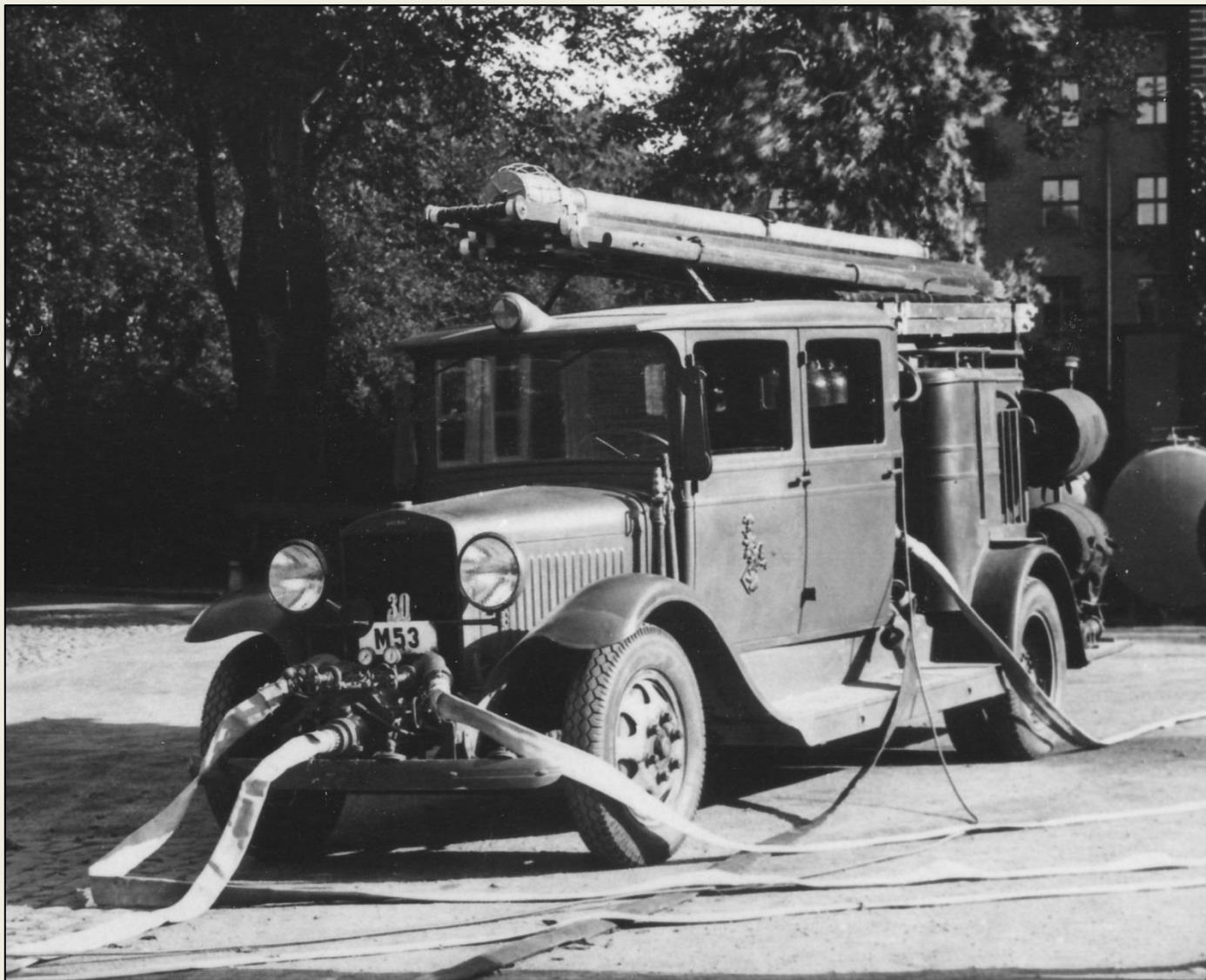
Bilden ovan är från en demonstration på huvudbrandstationens inre gård och visar den nu Limhamn-baserade M53 (nr 30) uppkopplad med vatten- och skumslangar. Bilden är från början av 1940-talet.