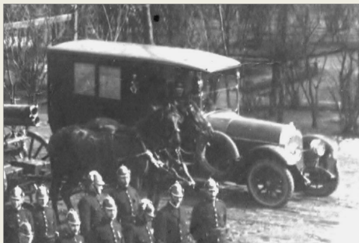
Uppställning framför lilla redskapshuset 1919.