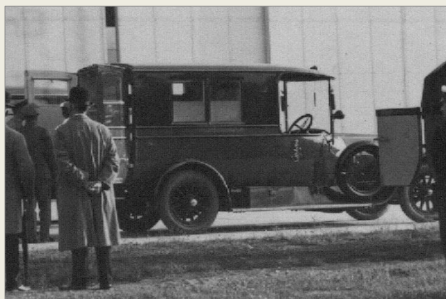
Bilen vid visning på Bulltofta på 30-talet. Moderniserad med rött ljus på taket, utvändiga backspeglar och stadsvapnet nedflyttat.